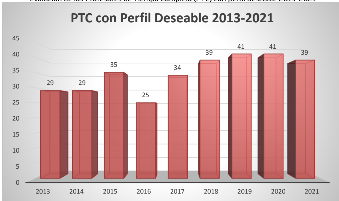
Evolución de los Profesores de Tiempo Completo (PTC) con perfil deseable 2013-2021

Fuente: Departamento de Gestión Académica, UNISTMO 2021, con corte al 30 de septiembre de 2021.